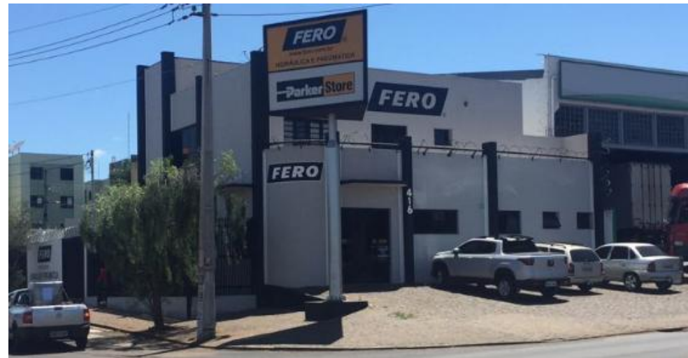
FERO – UBERABA