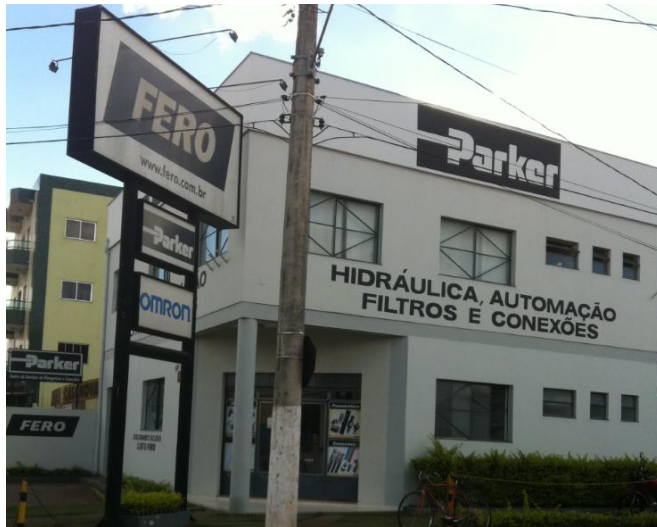
FERO – PATOS DE MINAS